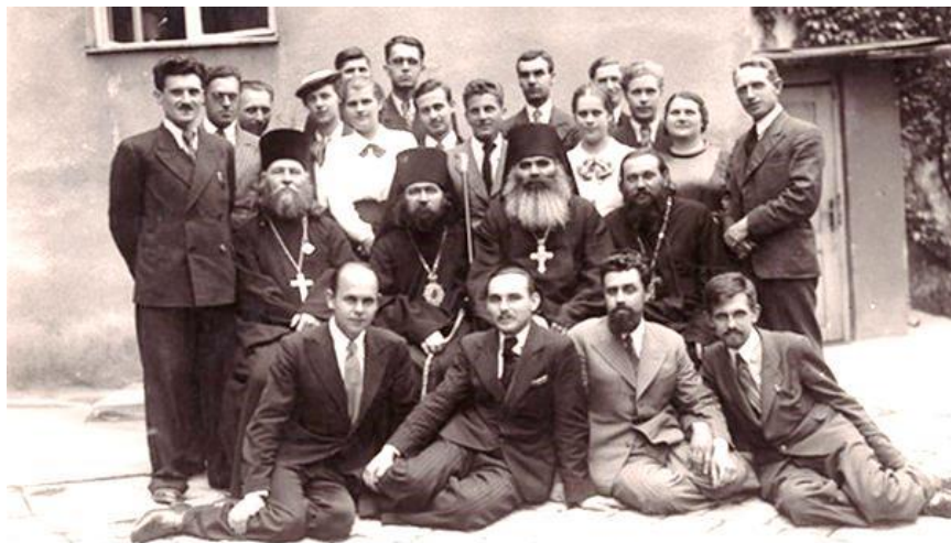
Святитель Иоанн в Сербии (сидит среди духовенства второй слева).

Русское лихолетье вынудило семью Максимовичей покинуть Родину и эвакуироваться в Югославию, где Михаилу удалось поступить на богословский факультет Университета святого Саввы и окончить его в 1925 году. Еще на последнем курсе Михаил в Белградской церкви был посвящен митрополитом Антонием (Храповицким) во чтеца, а в