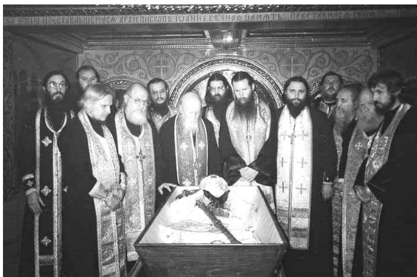
Обретение мощей святителя Иоанна (Максимовича).

Земной путь святителя Иоанна завершился 19 июня (2 июля) 1966 г. Во время архипастырского посещения города Сиэтла с чудотворной иконой Божией Матери Курской Коренной, в возрасте