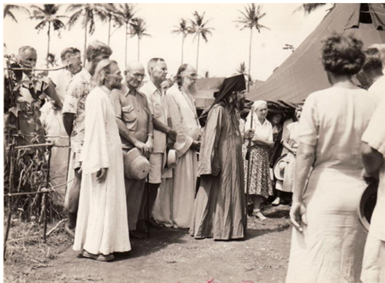
Святитель Иоанн на острове Тубабао.

был под угрозой тайфуна, который, однако, переменял курс и не задел его. Причину этого чудесного избавления видели в том, что святитель Иоанн каждую ночь обходил весь лагерь и осеял его крестным знаменем со всех четырех сторон. Чтобы русские беженцы смогли переехать в Соединённые Штаты Америки, святителю Иоанну пришлось отправиться в Вашингтон, где он приложил все усилия, чтобы гражданские власти внесли необходимые изменения в